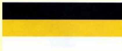
Государственный флаг Российской империи, утвержденный в 1858 г.