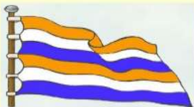
Флаг Российского государства эпохи Петра I