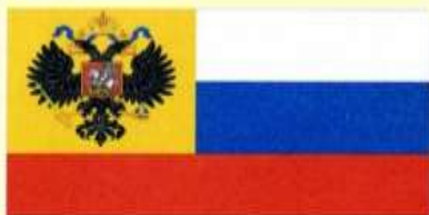
Последний Государственный флаг Российской империи