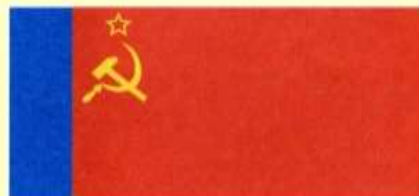
Государственный флаг Российской Советской Федеративной Социалистической Республики