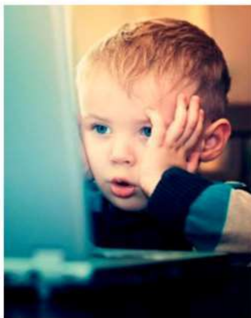
Интернет может быть опасен!

ДЕТЯМ ДО 5 ЛЕТ НЕ РЕКОМЕНДУЕТСЯ ПОЛЬЗОВАТЬСЯ КОМПЬЮТЕРОМ. ДЕТЯМ 5-7 ЛЕТ МОЖНО -ОБЩАТЬСЯ- С КОМПЬЮТЕРОМ НЕ БОЛЕЕ 10-15 МИНУТ В ДЕНЬ 3-4 РАЗА В НЕДЕЛЮ.